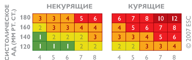
ОБЩИЙ ХОЛЕСТЕРИН ШКАЛА ОТНОСИТЕЛЬНОГО РИСКА

Для людей моложе 40 лет рекомендуется пользоваться Шкалой относительного риска . Шкала используется безотносительно пола и возраста человека и учитывает три фактора: систолическое (верхнее) артериальное давление, уровень общего холестерина и факт курения . Технология ее использования аналогична таковой для основной Шкалы SCORE.